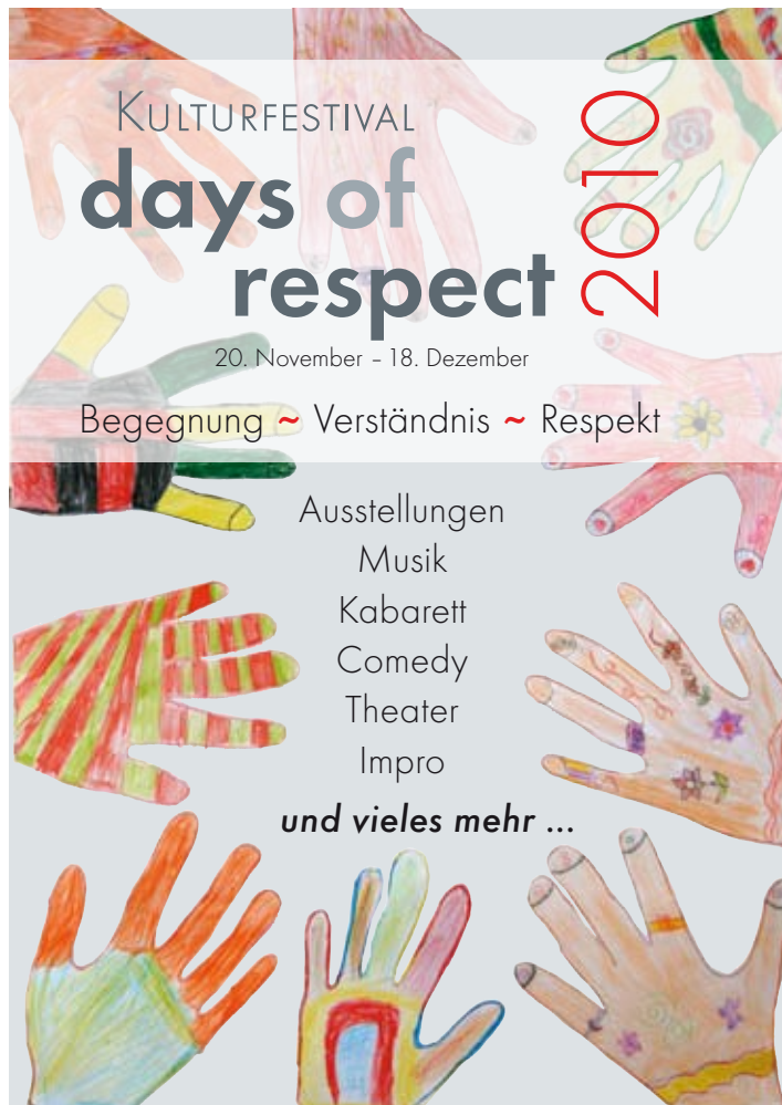
Die Hände entstanden anlässlich eines Malwettbewerbs der Kirchnerschule für days of respect 2008

Interkulturelle Bühne e.V. Alt Bornheim 32 60385 Frankfurt am Main 069 - 46003741